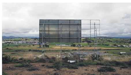
Impasse . Proyección, 12 min, 2013.