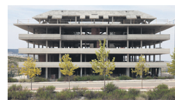
Alzados . Video-instalación, 2 canales en loop, 2014.

Llegados a este punto final, podemos decir que, en mayor o menor grado, la reflexión estética de Smithson, la ruina improductiva de Solà-Morales, el tercer paisaje de Clément, el mapeo de lo impredecible de Serres, la presencia discreta de Fulton y la épica inútil de Aljés están presentes en Acta de replanteo .