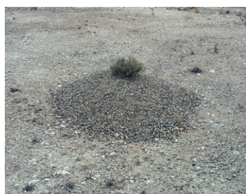
Montones. Arena. Fotografía, 130 × 165 cm, 2014.