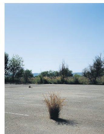
Sin título 1, serie Sitescape. Fotografía, 93 × 74 cm, 2009.

En este sentido, los intereses de Yeregui le llevan a conectar con diversos teóricos del paisaje urbano. Especialmente con aquellos que han intentado estudiar los espacios intermedios que genera la ciudad contemporánea; lugares definidos más por la ausencia de función que por su uso concreto. Me refiero al Terrain vague 3 de Ignasi de Solà-Morales o al concepto de “tercer paisaje” 4 de Gilles Clément. En el primer caso, Solà-Morales reivindica la identidad genuina de estos espacios, reclamando su valor como ruina contemporánea sin la necesidad de reconvertirlos en lugares productivos. En el segundo, Clément define un tipo de paisaje que no es natural y tampoco es urbano. Un paisaje híbrido, situado entre la fuerza imposible de la naturaleza y el fracaso del artificio humano.