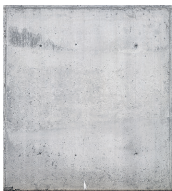
39m² . Intervención site-specific , dimensiones variables, 2016.

Finalmente, la exposición incorpora una publicación en formato periódico. Al margen de ser un catálogo al uso, en este caso el periódico se transforma en una obra portátil que incorpora el séptimo capítulo de la muestra. Un archivo de pilares retratados metódicamente por el artista para ofrecer una última visión fragmentada e incompleta del espacio abandonado: el inicio de una posible construcción entendido como el cierre simbólico de su proyecto. Esta pieza gráfica se convierte en una colección de pósters, otorgando así una nueva función estética a la inoperancia de los pilares.