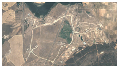
El Reino de Don Quijote, Ciudad Real. Imagen de Google Earth.

El valor de la experiencia directa que caracteriza la obra de Jorge Yeregui me invita a pensar en otros artistas de referencia: el británico Hamish Fulton, el gran artista del caminar por la naturaleza; y el belga afincado en Méjico Francis Alÿs, figura clave en la configuración de la performance urbana. Deduzco en su manera de trabajar similitudes con uno y con otro. De Fulton, su invisibilidad y discreción en el paisaje: no dejar huella de su paso, traduciendo su experiencia a base de imágenes y datos de carácter geográfico (cotas altimétricas superadas, millas recorridas, etc.). Pienso en Walking beside the River