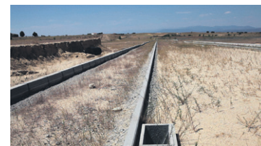
Líneas maestras. Video-instalación, 4 canales en loop, 2013.

Vechte (1997), donde el artista resume su idea del caminar en una sola frase: Walks are like clouds. They come and go (Los paseos son como las nubes. Vienen y se van). De Alÿs, su activación del entorno a través de la expectativa y el reto. Aquí me dejó llevar por Sometimes Making Something Leads to Nothing , también de 1997, acción en la que el artista arrastra un cubo de hielo por las calles de México D. F. hasta que éste se deshace. El título también exhibe a la perfección el carácter épico y disfuncional de su trabajo: Algunas veces, el hacer algo no lleva a nada.